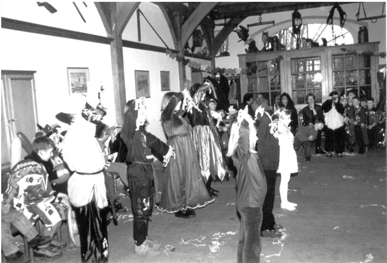
Karneval in Ibbenbüren