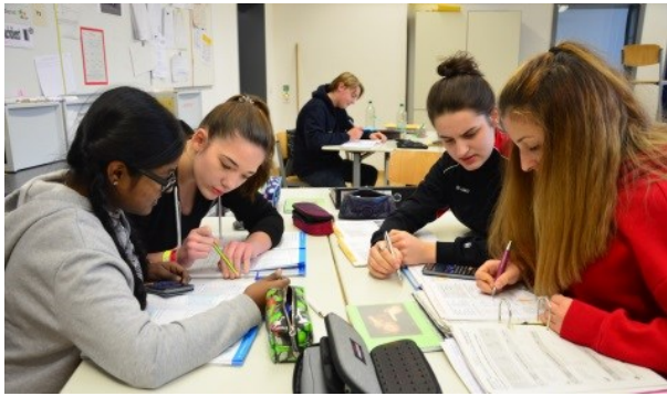
Selbstständiges und projektorientiertes Lernen an der Gesamtschule Münster Mitte