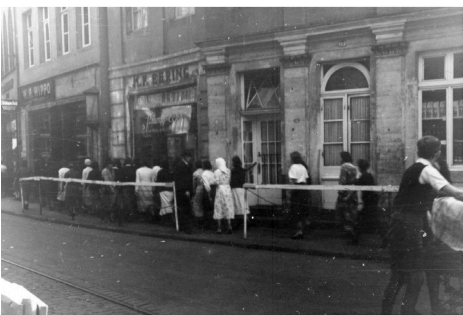
Eine Gruppe ukrainischer Hausmädchen geht vor dem Gertrudenhof (Warendorfer Straße) spazieren. Sie hatten nur wenige Stunden Ausgang in der Woche und durften keinen Kontakt zur deutschen Bevölkerung haben.

Ausländische Arbeiter wurden zunächst auf freiwilliger Basis, ab April 1942 zunehmend unter Zwang in großer Zahl für das Reich rekrutiert. Sie stammten vornehmlich aus den von der deutschen Wehrmacht besetzten Ostgebieten. Die radikalen und teilweise brutalen Rekrutierungsmaßnahmen förderten den Widerstand der Zivilbevölkerung.