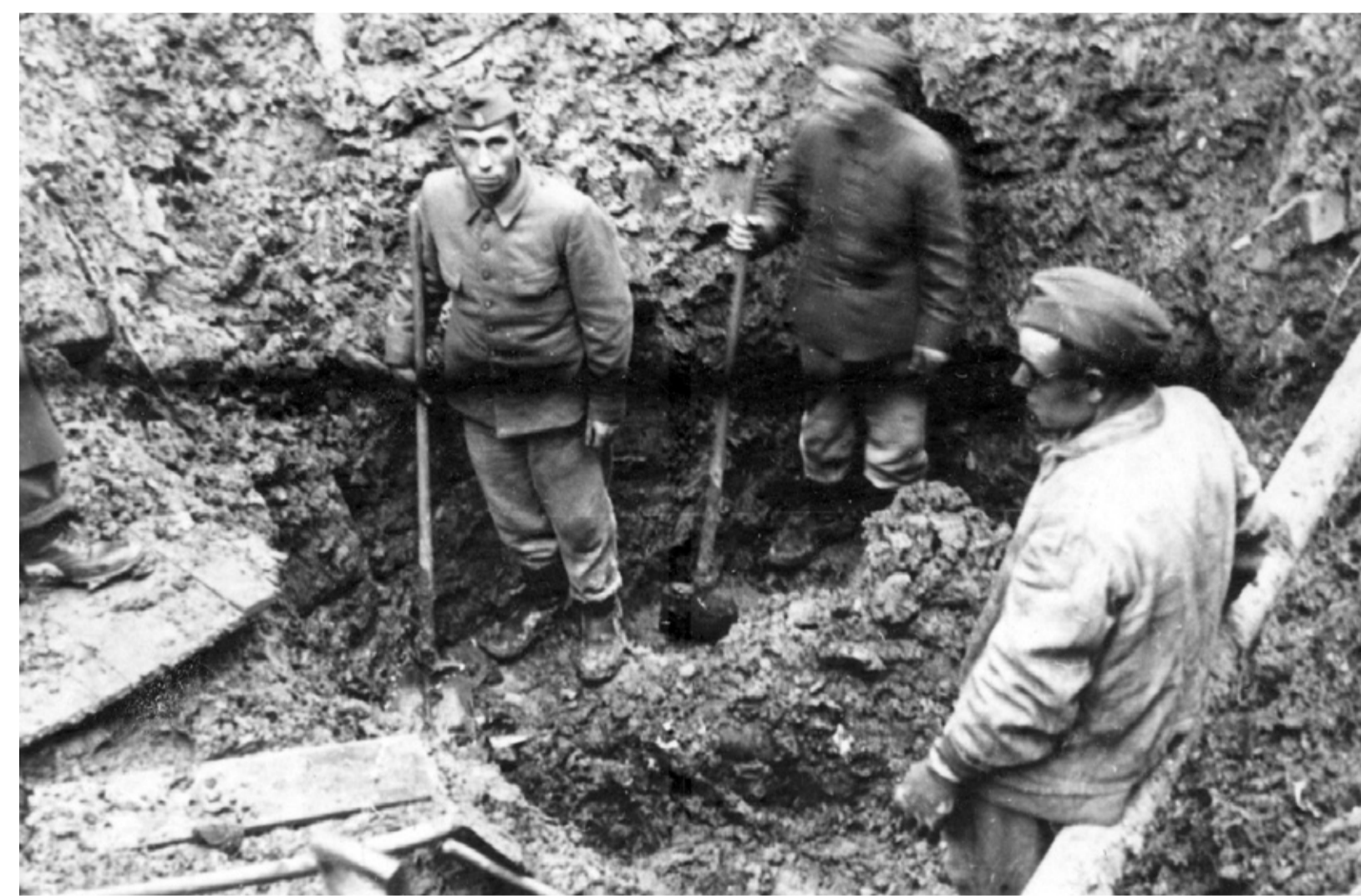
Ukrainischer Zwangsarbeiter bei der Leichenbergung nach einem Bombenangriff in der Grünen Gasse, wo sie härtester körperlicher Arbeit und psychischer Belastung ausgesetzt waren. (November 1943)

Auch in Münster wurde der Einsatz von Zwangsarbeitern bald zu einem unabdingbaren Bestandteil, damit ein reibungsloser Ablauf der Wirtschaft und auch des alltäglichen Lebens gewährleistet werden konnte. Das Landesarbeitsamt Münster verzeichnete für den Zeitraum vom 15. August 1944 / 15. Februar