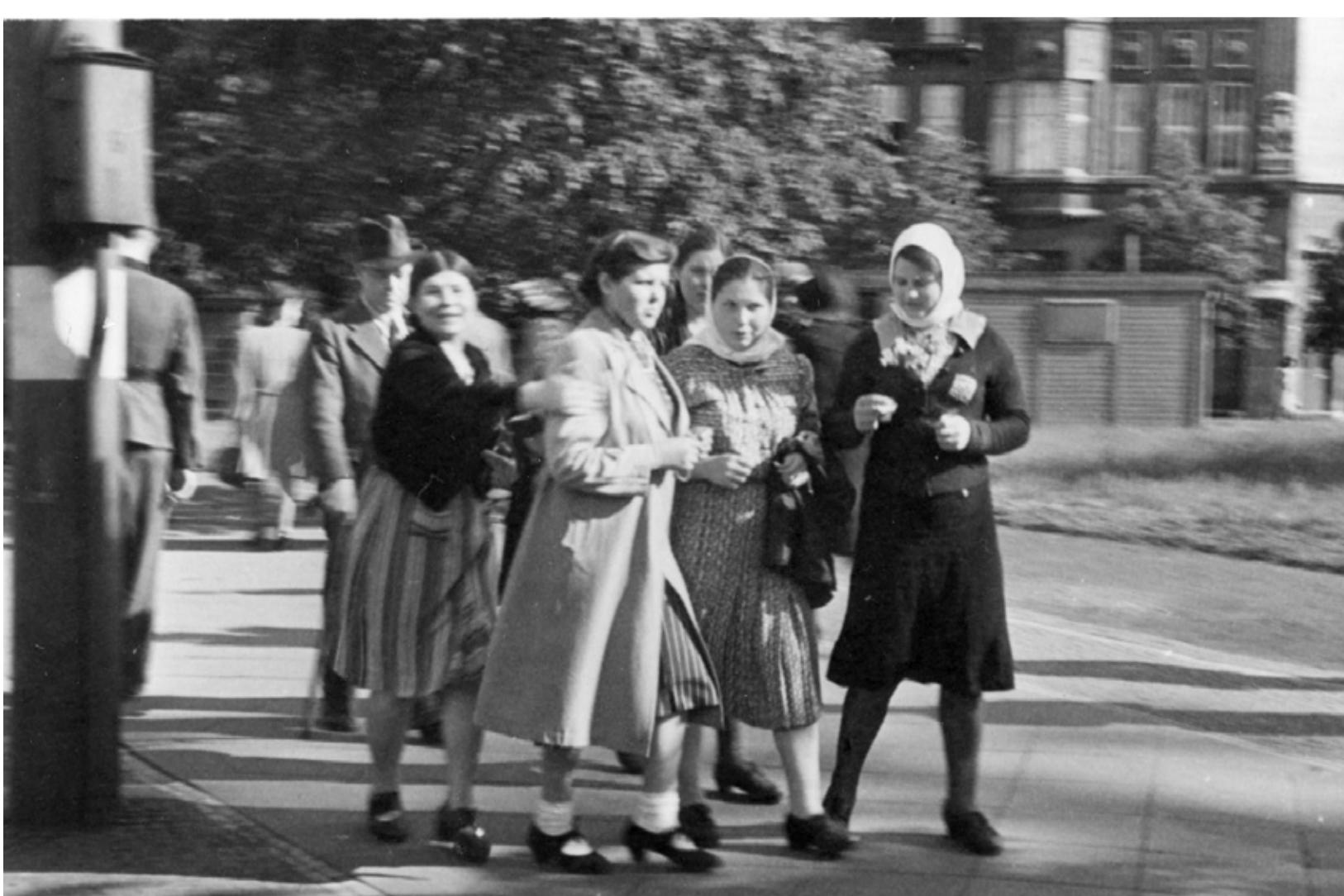
Eine Gruppe ukrainischer Arbeiterinnen passiert die Ludgerstraße (August 1942). Viele Zwangsarbeiterinnen waren als Kindermädchen in privaten Haushalten untergebracht – trotz ihres sehr jungen Alters.