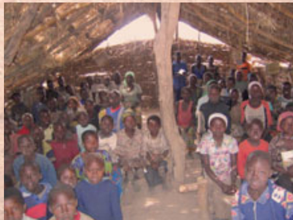
Dorfschule in Koumaye (Dorf im Tschad)