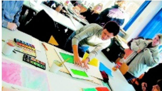
Berufstätigen bietet das Abendgymnasium die Gelegenheit, ihr Wissen zu erweitern und ihre Fähigkeiten auszubauen.

Das Abendgymnasium ist zwar, wie das Wort sagt, ein Gymnasium am Abend; aber es unterscheidet sich nicht nur durch den Hinweis auf den Abend vom Tagesgymnasium. Während das Tagesgymnasium von Jugendlichen und jungen, berufsunerfahrenen Erwachsenen besucht