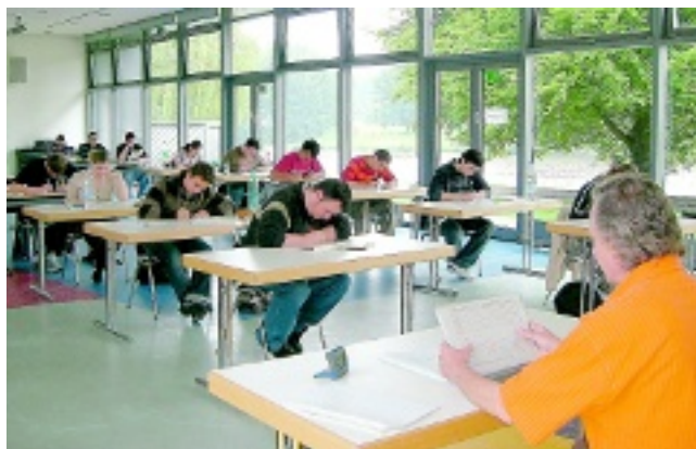
Nach den Abschlussklausuren und den mündlichen Prüfungen haben die Schüler die Prüfungsphase überstanden.

Das nächste Semester beginnt am 11. August. Wer sich für den Besuch der Schule interessiert, sollte sich unter www.abendreal-schule-ms.de informieren oder sich unter ☎ 0 251 / 52 47 94 für einen Infonachmittag anmelden.